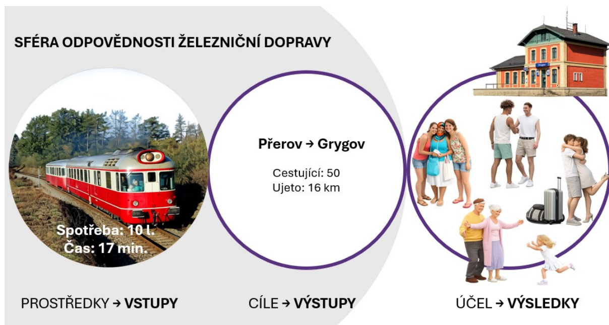
Obrázek 1: Provázanost účelu, cílů a prostředků

kteří dochází v přímém důsledku použití dopravního prostředku. Výsledkem jsou setkání cestujících s lidmi v cílové stanici. Železniční doprava odpovídá za vlak, který dojede cíle, nikoli za setkání lidí v cíli.